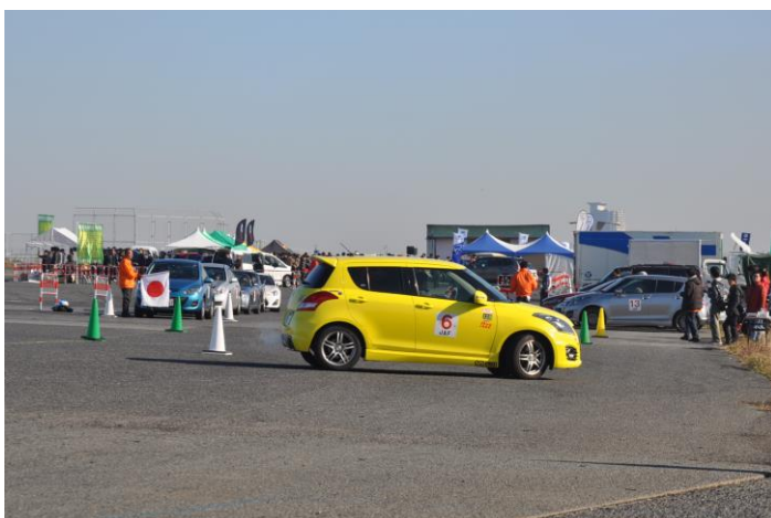
イベント開催イメージ