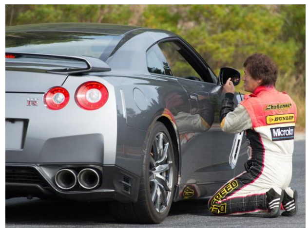
レッスンイメージ