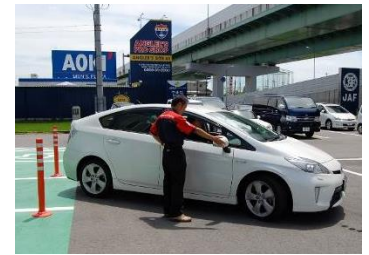
車庫入れセミナーの様子

このセミナーは、 これからも車の運転を続けたい65歳以上のドライバーを対象に、今後も安心なカーライフを続けていただくことを目的として J A F のベテランインストラクターが 1 対 1 でレクチャーする講習会 です。