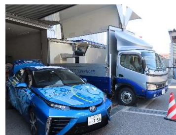
TOYOTA MIRAIと JAFシートベルトコンビンサー

FCV (燃料電池自動車) は、二酸化炭素を排出しないエコエネルギーであるだけでなく、非常時等に「移動する電源」としての活用が期待されています。今回のイベントは、JAFの模擬衝突体験車であるシートベルトコンビンサーとタイヤ空気圧点検の電源をMIRAIからの給電で賄うという試みのもと開催します。環境に配慮したエネルギーがもつ可能性も体感していただけます。