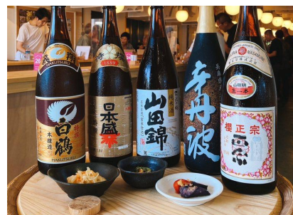
灘五郷のお酒とお料理のペアリング