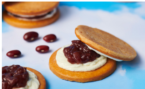
あさぎり牛乳サブレスサンド （あんバター）