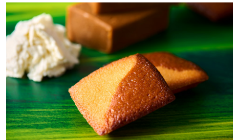
あさぎり牛乳 ダブルチーズフィナンシェ