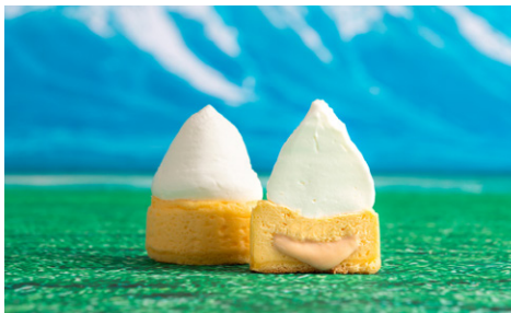
生とろりチーズケーキ 「生富士山」