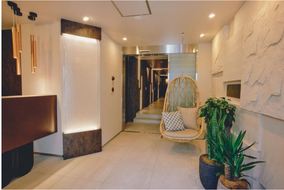
パーソナル・サウナ KUU エントランス

癒やしを超えた、自分回帰の空間として「パーソナル・サウナ KUU」が5月20日（金）9:00～にグランドオープンいたします。