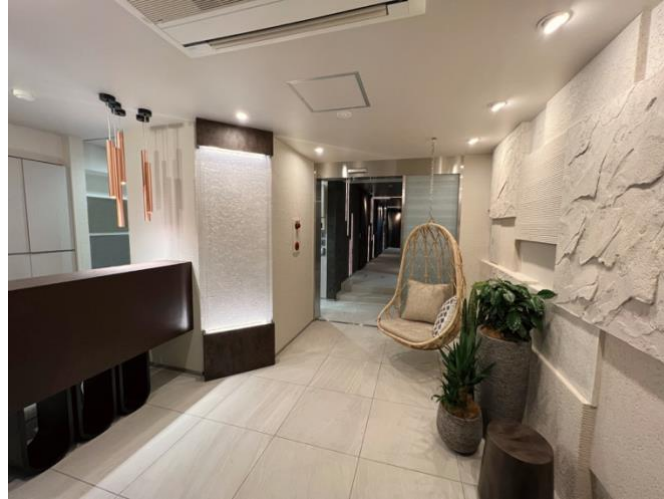
パーソナル・サウナ KUU エントランス

癒やしを超えた、自分回帰の空間として「パーソナル・サウナ KUU」を表参道にオープンいたします。2022年5月12日にプレオープン、5月20日にグランドオープンとなり、プレオープンに先駆けて抽選で37名無料ご招待キャンペーンの実施をお知らせいたします。