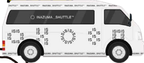
10人乗りハイエース車両1台

伊豆稲取駅 3キロ圏内の36カ所の停留所に行きたいときに、東伊豆町LINEから予約するか、町役場に電話するだけで迎えに来てくれる、新しい交通システムです。