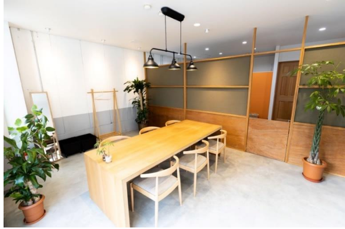
木の温もりを体感できるショールーム 観葉植物にもこだわり、実際の暮らしをイメージできる空間となっております。