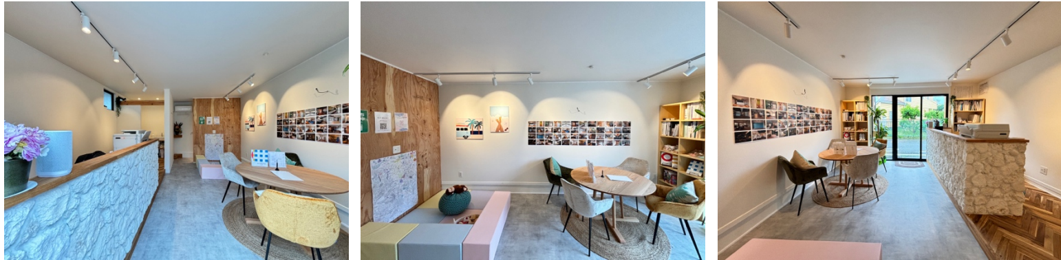
湘南辻堂の雰囲気に合うような明るく開放的なショールーム。 キッズスペースがございますのでお子様連れのご家族も安心してお過ごしいただけます。

今後は心地よい暮らしをテーマにしたリノベーション物件の販売も予定しております。地元根差し、地元の他業種との協業をはかりながら今後の湘南エリアの活性に貢献して参りたいと考えております。