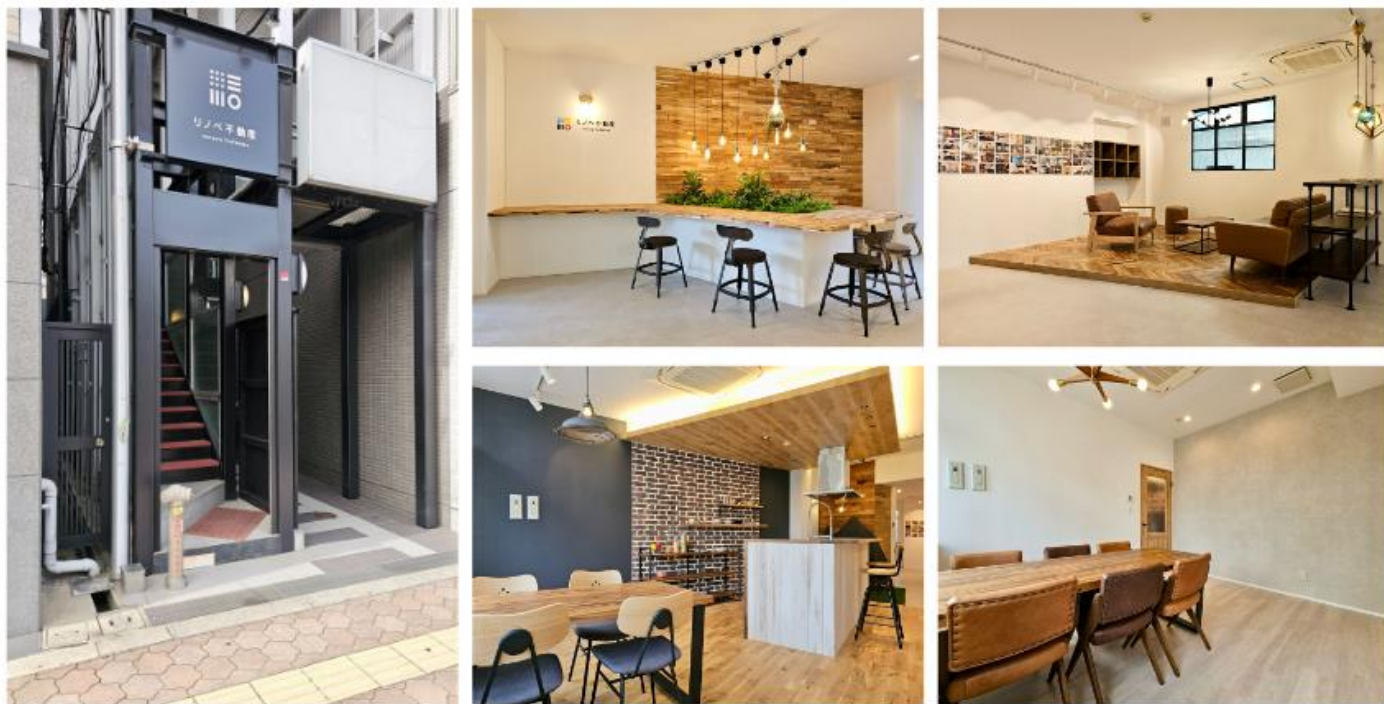
彩り豊かな木材を使った暖かみのあるショールーム お住まい探しでご不明点等ございましたら、お気軽にご相談くださいませ

「リノベ不動産都島駅店」では、住まい探しからリノベーションデザイン、施工までを一貫してサポートし、お客様ファーストの住まい作りをお手伝いいたします。また、リノベーションのみのご相談も承っておりますので、ぜひお気軽にショールームにお越しください。