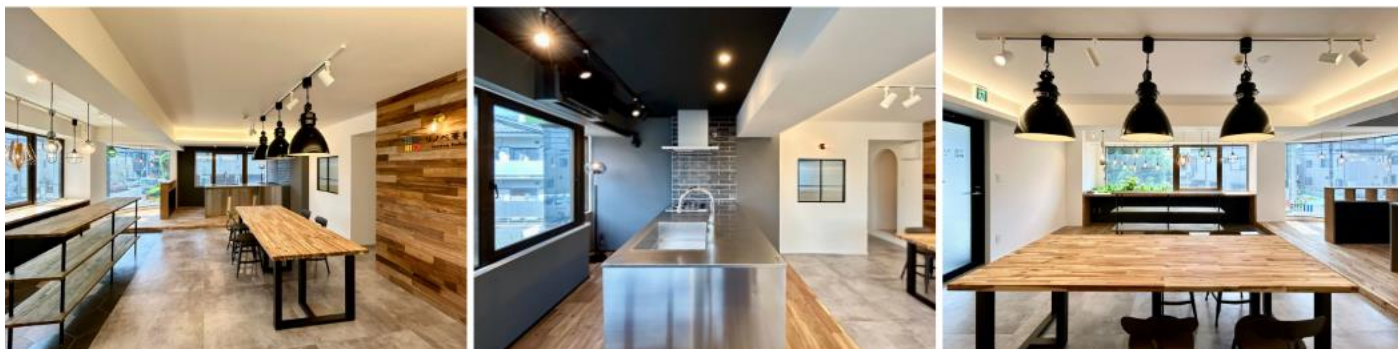
インダストリアルな雰囲気と木材のぬくもりを感じられるショールーム お住まい探しでご不明点等ございましたら、お気軽にご相談くださいませ

お客様に寄り添い、お客様のワクワクする日々の生活と夢の実現のため、私たちは「中古住宅+リノベーション」のワンストップサービスを提供してまいります。