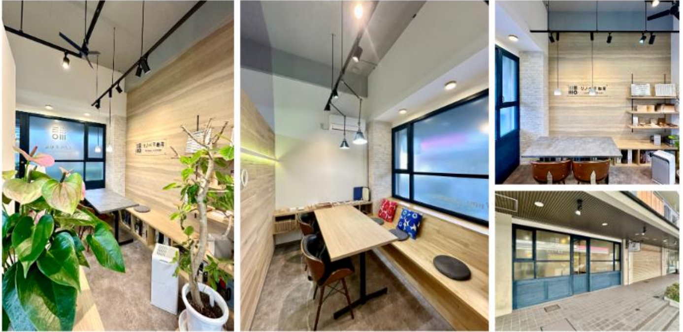
ナチュラルテイストならではの木のぬくもりと落ち着いた雰囲気を感じられるショールーム お住まい探しでご不明点等ございましたら、お気軽にご相談くださいませ

今後は、住宅のリフォームおよびリノベーション事業に加え、住まい探しからリノベーションの施工までを一貫してサポートし、「中古住宅+リノベーション」という新たな選択肢をお客様にご提案できるようになりました。