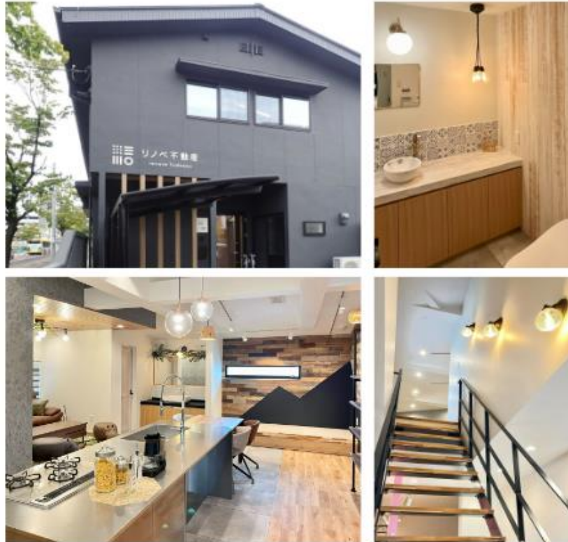
木のぬくもりを感じられる明るいショールーム お住まい探してご不明点等ございましたら、お気軽にご相談くださいませ

地域の担い手として、今後も「安心・安全な町づくり」と、明るい笑顔があふれるワクワクする住まいづくりに取り組み、お客様から「頼んでよかった！」と提供いただける魅力的な住空間を提供し続けてまいります。