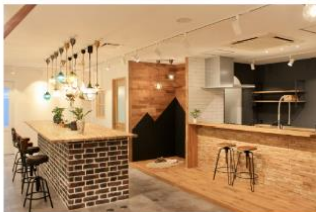
木をふんだんに使ったナチュラルテイストなショールーム お住まい探しでご不明点等ございましたら、お気軽にご相談くださいませ