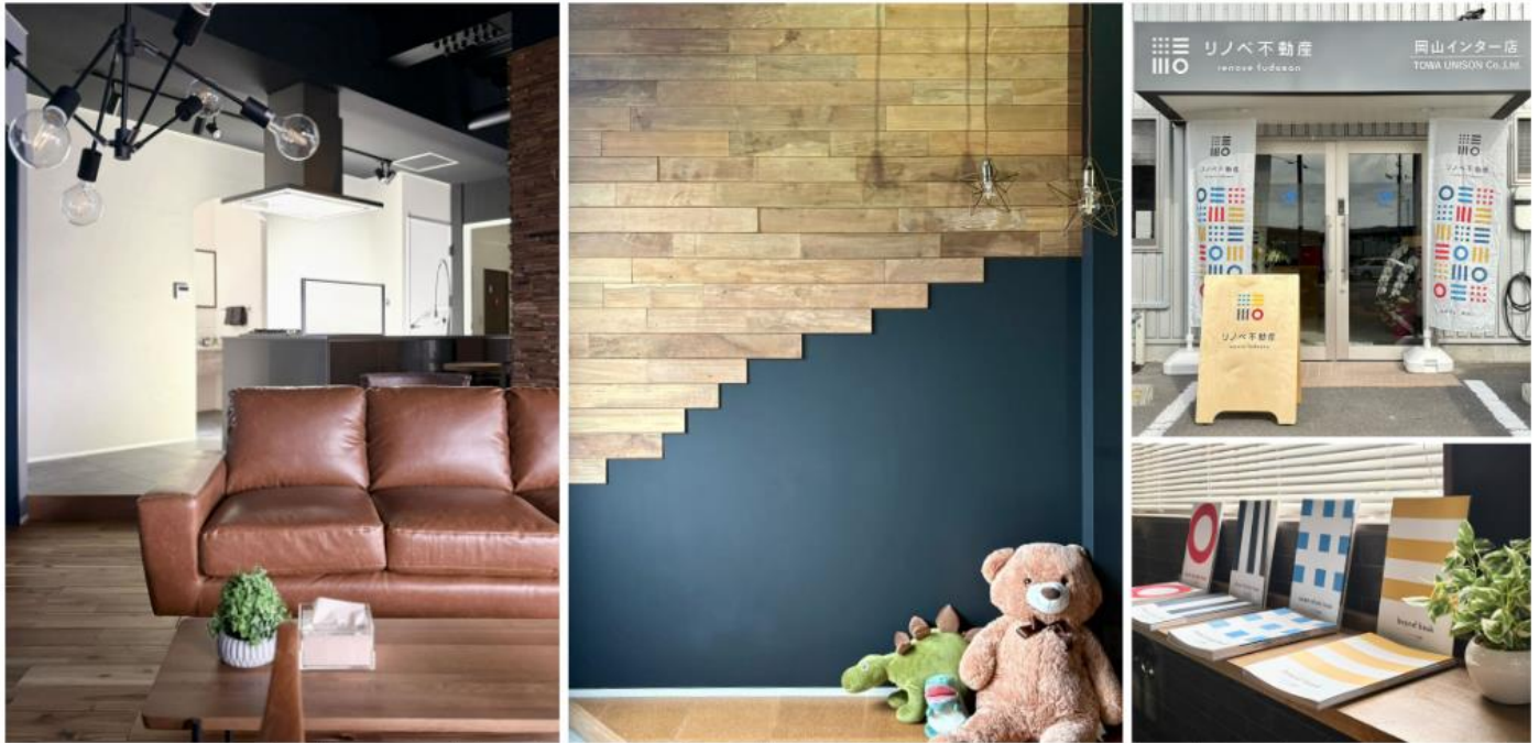
キッズスペースもございますので、お子様連れのご家族でも安心してお打ち合わせをすることが可能です。お住まい探しでご不明点等ございましたら、お気軽にご相談くださいませ。

ぜひお気軽にショールームへお越しください。皆さまのお越しを心よりお待ちしております。