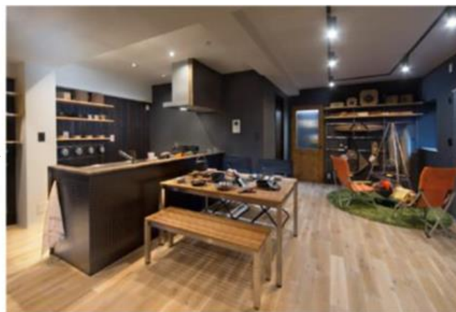
【After】urban outdoor リノベーション