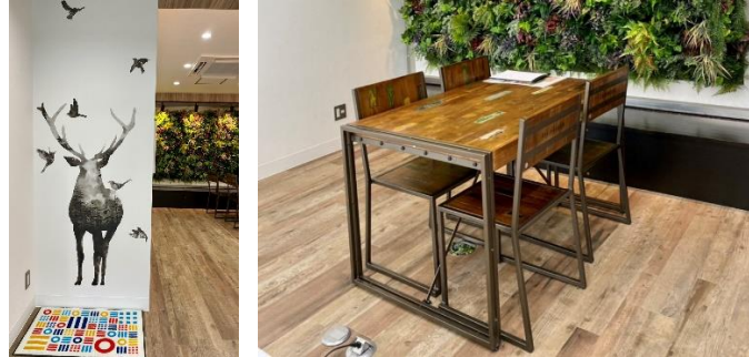
ショールームに踏み入れると目に入ってくるウォールグリーン、大きな造作カウンターや間接照明が印象的