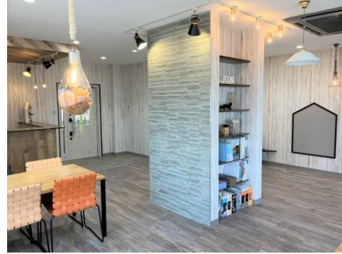
壁や床材、照明などリノベーションを体感いただける、カフェのような開放的なショールーム