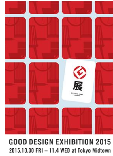
GOOD DESIGN EXHIBITION 2015 2015.10.30 FRI - 11.4 WED at Tokyo Midtown

会 期： 10月30日(金) -11月4日(水) 時 間： 10月30日(金) 13:00 - 20:00 10月31日(土) -11月3日(火・祝) 11:00 - 20:00 11月4日(水) 11:00 - 17:30 会 場： 東京ミッドタウン (東京都港区赤坂 9-7-1) 料 金： 1,000円 (一部入場料が不要なエリアがあります) 主 催： 公益財団法人日本デザイン振興会 後 援： 経済産業省／中小企業庁／東京都／日本商工会議所／ 日本貿易振興機構(JETRO)／国際機関日本アセアンセンター／ 日本放送協会／日本経済新聞社／読売新聞社