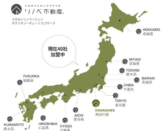
全国展開中！ 中古購入+リノベーション 2016年100店舗オープン予定