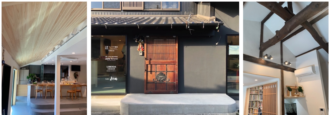
古民家をリノベーションしたショールーム。

リノベーションを通してワクワクする暮らしを創っていく株式会社 WAKUWAKU とともに、同じ志を持ち、「リノベ不動産 | 知多阿久比店」として地元の皆様に愛される企業として進化成長して参ります。どうぞよろしくお願いいたします。