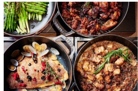
チキン・ポークなども提供（イメージ）