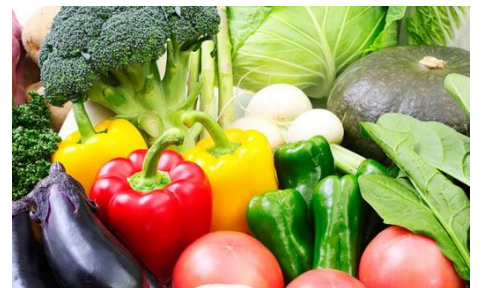
人気のお礼の品「旬のおまかせ野菜詰合せ」 （イメージ）