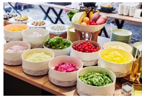
ビュッフェのサラダコーナー（イメージ）