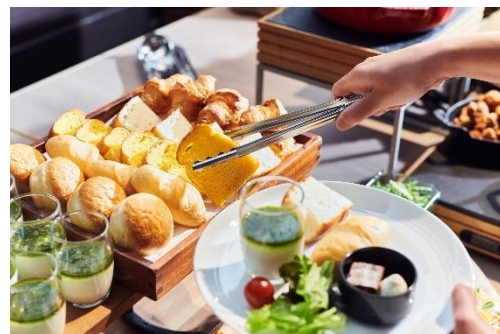
朝食ビュッフェ（イメージ）