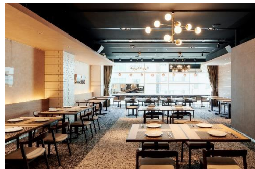
改装したレストラン店内