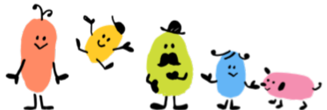
ズッコファミリーキャラクター