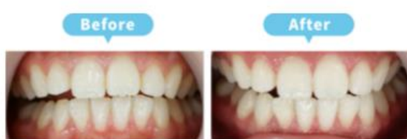
20代女性 2段階アップ(A2→B2)

施術内容： ホームホワイトニング 費用： 19,800円(税込) 治療期間： 3週間