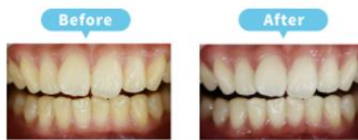
20代女性 6段階アップ(A3→B2)

施術内容： ホームホワイトニング 費用： 19,800円(税込) 治療期間： 3週間