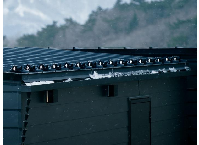
オフグリッド設備 (太陽光発電システム) *