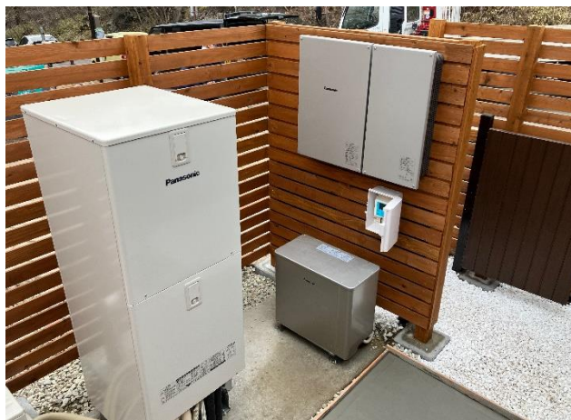
オフグリッド設備 (蓄電池・パワコン)