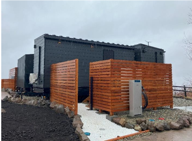
オフグリッド設備 (V2H システム)