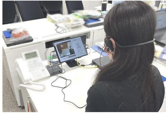
※2F 事務所にて応答する様子

大成株式会社は今後も機能の向上とアップデートを引き続き行い、「T-Concierge」を通じて、受付業務のDX化を推進してまいります。