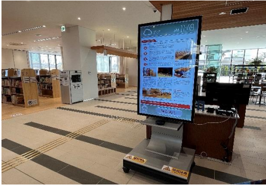
※サイネージとしての利用の様子