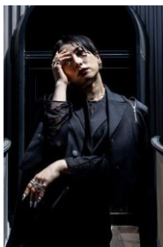
完成度 : MEDUSA (ebony)

チーム活動をしながらも現在はMedical Concierge I'moonのメンバーとしてD.LEAGUEで活躍中。