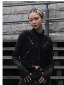
クリエイション : RIN. (Novel Nextus)

ファンファーレという女性3人組チームや、ソロ、他ジャンルダンサーとのユニット、ミュージシャンとのライブ、国内外で活躍中。