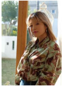
スキル : yu-ki.☆ (ファンファーレ)