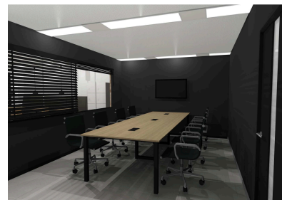
会議室（完成イメージ）