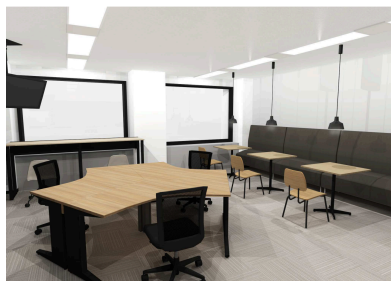
執務室（完成イメージ）