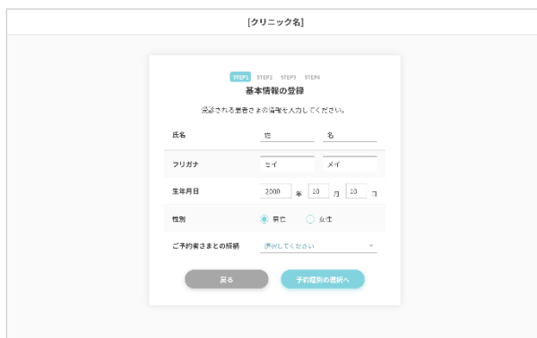
▼PCで見た画面イメージ