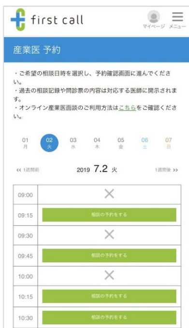
産業医面談の予約画面