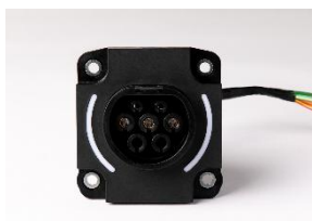
照明付きインレット

クルマの安心・安全・快適・利便というキーワードをもとに、ヘッドアップディスプレイや量産メータ、照明などを多数展示。メータはクルマ以外にも農建機・小型モビリティ向けも展示。また、展示会初公開製品として「二輪向けスマートメータ」や「USBチャージャ」もご用意しておりますので、ぜひ実際の製品をご覧ください。