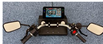
二輪向けスマートメータ