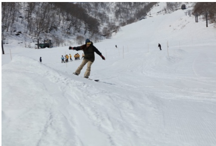
アルプススノーパーク

第1リフト発券所には新たに自動発券機を設置。多言語に対応するほか、事前オンライン決済も可能となり、キャッシュレスでスムーズな購入を実現します。当スキー場は、滑走者の利便性を高める取り組みを充実させ、より快適で思い出に残るウィンタースポーツ体験を提供してまいります。