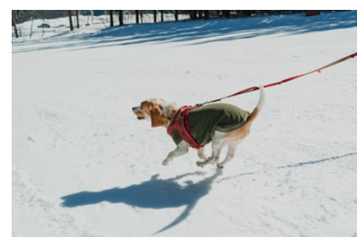
ペットも楽しめるゲレンデ