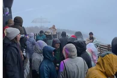
DJ イベント（イメージ）