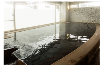
白馬アルプスホテル 温泉