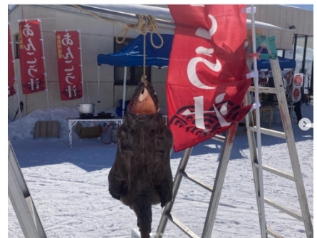
アンコウ解体ショー