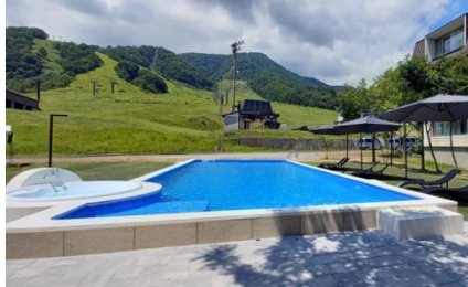
屋外プール（イメージ）

「白馬乗鞍アクアオアシス」の屋外エリアで開催されるプールサイド DJ イベントを開催予定。雪化粧をまとった雄大な山々を背景に、熱気あふれるサウンドが響き渡る全国でもここだけの DJ イベントです。イルミネーションが雪山とプールサイドを彩り、非日常空間が広がります。スキーやスノーボードで汗をかいた後に、プールや露天ジェットバスに浸かりながら音楽に身をまかせる、特別な冬をご体感ください。