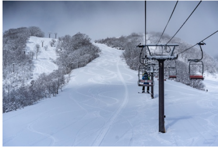
アルプス第3リフト