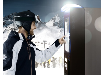
新自動発券機（イメージ）