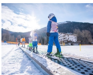
ベルトコンベア式登坂装置サンキッド （イメージ）