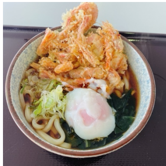
甘えびかき揚げうどん