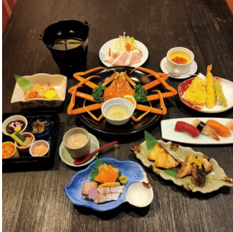
越後産ホンズワイカニ1ハイ寒ブリプラン

さらに、昨年好評だった、ブリの解体ショーを1月に、糸魚川荒波アンコウ解体ショーを2月に実施予定です。美しい白銀の景色を眺めながら、獲れたての海の幸を味わう贅沢なひとときをお過ごしください。