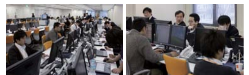
安全・安心もクオリティの一部です

「官庁での実績」から生まれたオールインワン・ソリューションを提供。ケー・デー・シーは、官公庁の事業運営に不可欠な「システム」「情報処理」「人材提供」をオールインワン・ソリューションとして提供。官公庁のお客様にとっていつでもなんでも相談できるパートナーとして、ある時はITツールの提供で、ある時は人材の提供で、ある時はエンジニアリング・コンサルタントとして、事業の安全・安心な実施、確実な管理・運営を可能にしています。