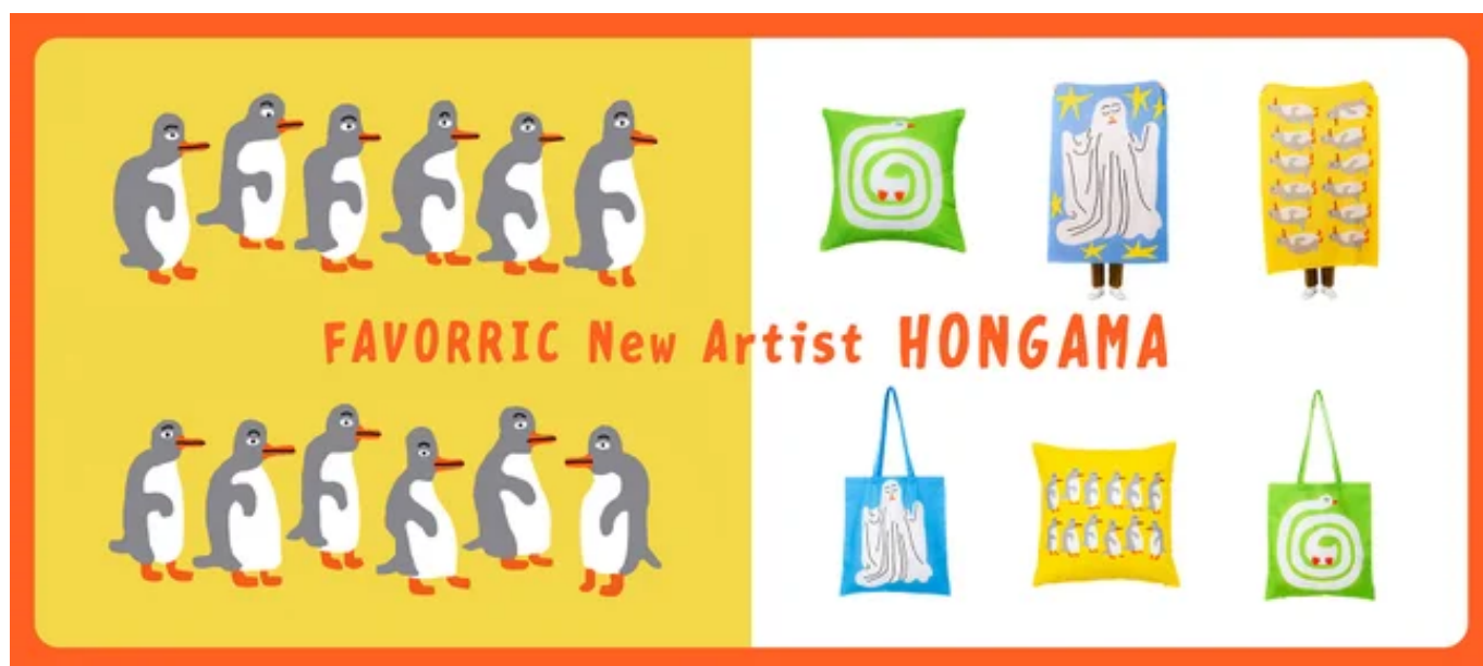
FAVORRIC New Artist 「HONGAMA」

幅広いメディアを横断しながら活動するイラストレーター「HONGAMA」がFAVORRICに参加決定。 2026年4月2日(木)よりFAVORRIC公式サイト・楽天市場にて販売開始！