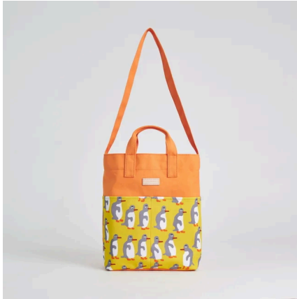
キャンバスショルダートートバッグ | ヨチヨチペンギン

キャンバストートバッグと対をなす、2WAY仕様のキャンバスショルダートートバッグ。ショルダー、手提げとシーンやコーディネートに合わせた使い方が出来るデザインが魅力です。