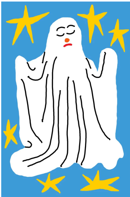
チカチカゴースト