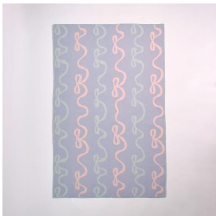
ウールブランケット | Soft dance