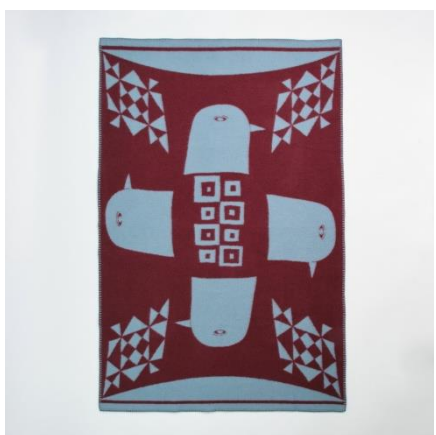
ウールブランケット | 記号