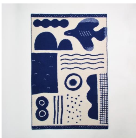
ウールブランケット | さかなのゆめ