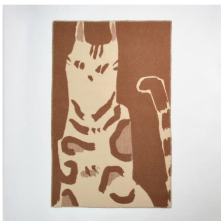
ウールブランケット | たたずむベンガル猫