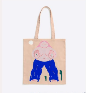
アイテム：トートバッグ