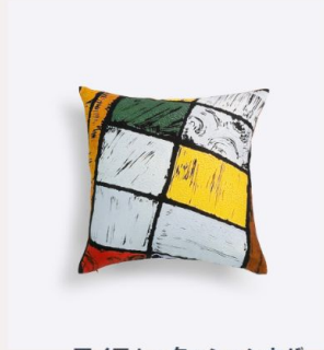
アイテム：クッションカバー