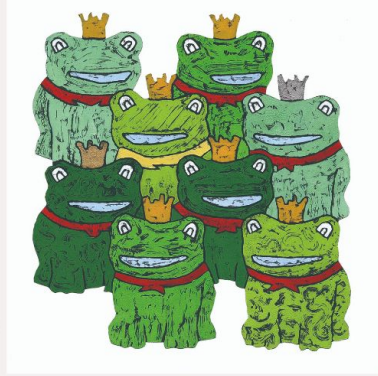
アート作品： 「かえる」