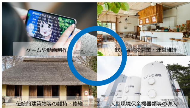
○プロジェクトに刻名できる一例