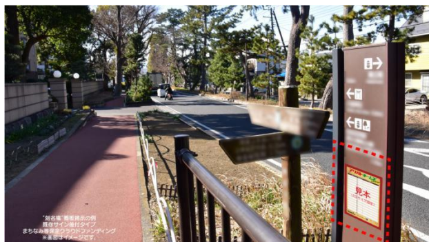
プロジェクト成立後、支援者のお名前を入れた看板のイメージ例

詳細、ご質問、ご相談、お申込み URL⇒ https://name-funding.jp/