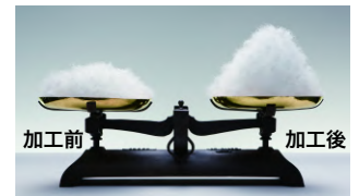
フレッシュアップ加工®