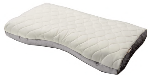
ファインクオリティプレミアム ダウン・フェザー&わた枕