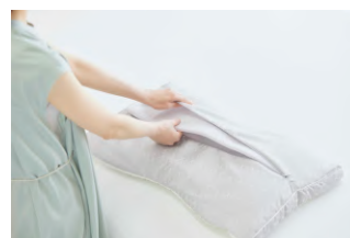
高さ調整用ウレタンシート

素材と高さの結果を基に、27種類のラインナップの中からご自身に合ったまくらをお選びいただけます。お手元に届いたら、高さ調整用のウレタンシートや詰め物を出し入れし、寝心地を確かめながら高さの微調整が可能です。サイトに掲載の適切なまくらの高さチェック項目も参考にしてください。