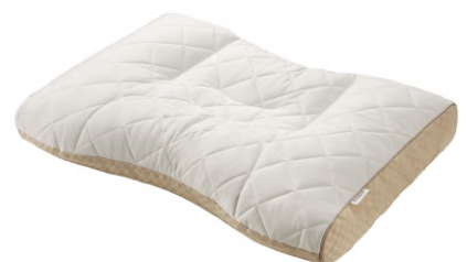
ベーシッククオリティ ミニパイプ枕