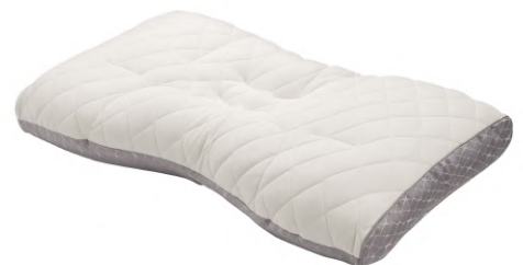
ファインクオリティ フワリーヌ®わた枕