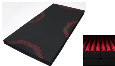
[エアーSI]マットレス ¥76,000円+税～

アスリートの遠征、ビジネスマンの出張など、外泊時のホテルなどで快適な眠りを提供します。