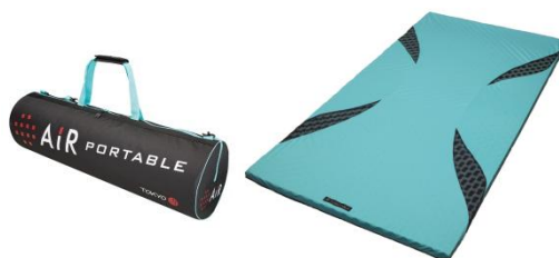
[エアーポータブル]モバイルマット ¥32,000+税