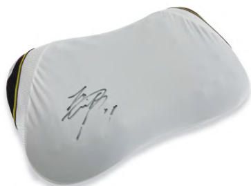
大谷翔平選手直筆サイン入りピロー