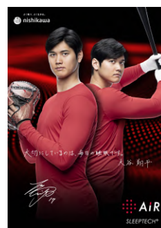
オリジナルクリアファイル