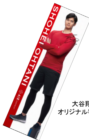
大谷翔平選手 オリジナル等身大タオル