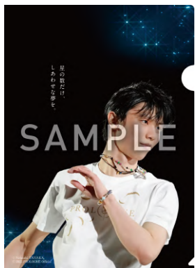
西川公式オンラインショップ限定