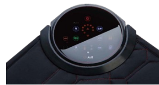
視認性の高い コントローラデザイン