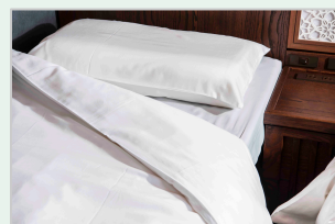
海島綿カバーリング