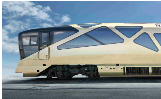
エクステリア デザイン