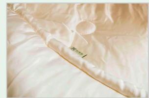
極上入金真綿掛けふとん