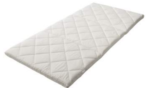
西川のキレイなふとん Aller-Wall 敷きふとん