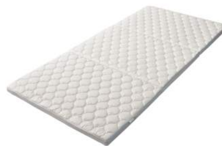
西川のキレイなふとん Medic Pure 敷きふとん