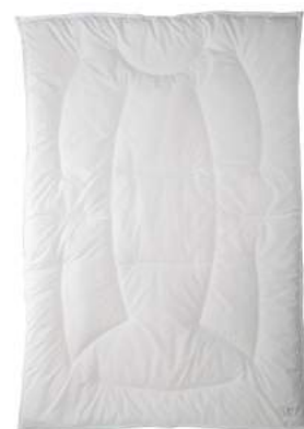
西川のキレイなふとん Medic Pure 合繊掛けふとん