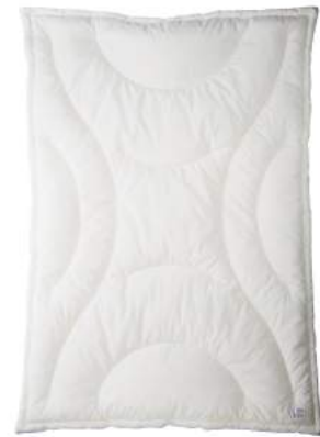
西川のキレイなふとん Aller-Wall 合繊掛けふとん