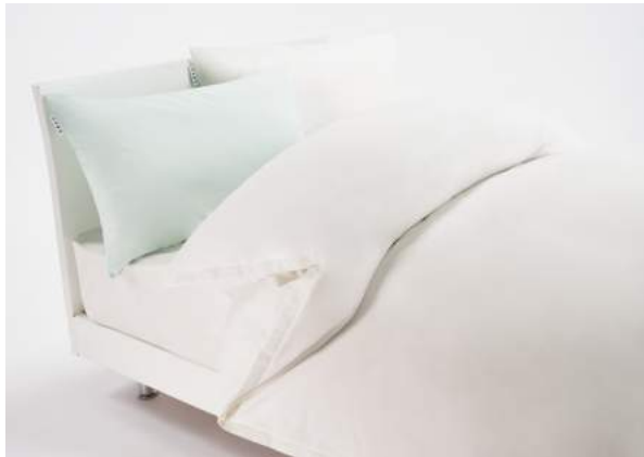
西川のキレイなふとん Medic Pure カバーリング

抗菌より優れた“制菌”作用の Medic Pure と メディックピュア ダニや花粉など、“アレル物質対策加工”の Aller-Wall が登場！ アレルウォール