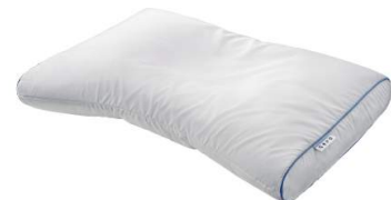
西川のキレイなふとん Aller-Wall まくら