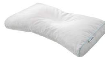
西川のキレイなふとん Medic Pure まくら