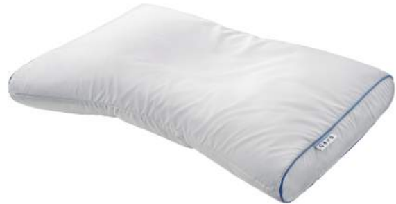
西川のキレイなふとん Aller-Wall まくら

西川株式会社(本社:東京都中央区日本橋 代表取締役社長:西川 やすゆき ハ一行)では、ワンランク上の快適・衛生機能を備えた寝具シリーズ『西川のキレイなふとん』を、2020年2月中旬より全国の百貨店、量販店、寝具専門店などで新発売します。「制菌加工」を施した『西川のキレイなふとん Medic Pure(メディックピュア)』と、「アレル物質対策加工」を施した『西川のキレイなふとん Aller-Wall(アレルウォール)』を展開します。