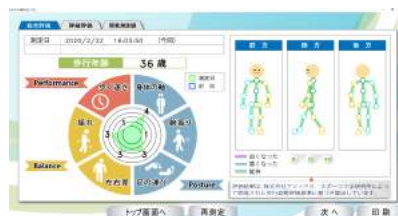
歩行姿勢測定システム※2

※2 (株)アシックスとNECソリューションイノベータ(株)が共同開発した「歩く姿勢」を数値化するシステム。