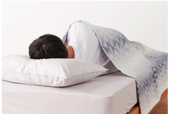
エアブリーズケット ® (ミドル)

西川株式会社(本社:東京都中央区日本橋 代表取締役社長:西川ハ一行)では、春夏向けタオルケットシリーズ『エアブリーズケット ® 』を新たなカラーと柄にリニューアルし、5月中旬より新発売します。西川公式オンラインショップをはじめ、全国の取り扱い店舗にて販売します。