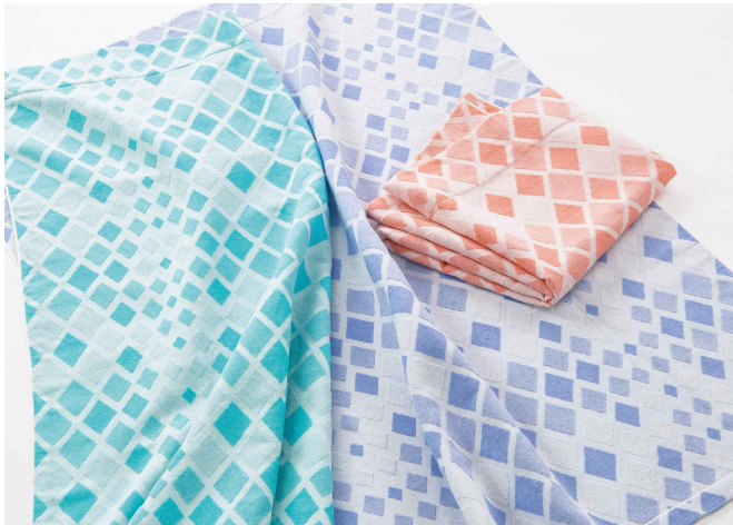
エアブリーズケット ® (ライト)