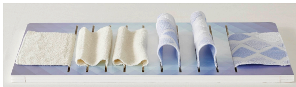
左：一般的なタオルケット 右：エアブリーズケット®