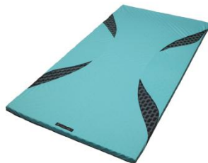
[エアポータブル]モバイルマット ¥32,000+税