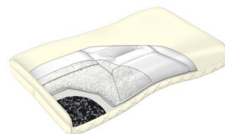
オーダーメイドピロー ¥25,000+税

いつでもどこでも、快適な睡眠をお届けしたい。モバイル性を追求して生まれたのが、[エアポータブル]モバイルマット。遠征先のホテルのベッドに一枚プラスするだけで、[エア]の機能を発揮し、快眠をサポートします。