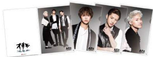
対象商品ご購入の景品