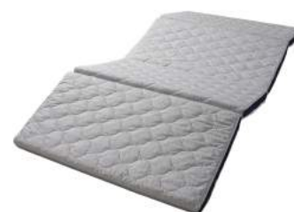
健康マットレス/軽量・コンパクト

「Afit」は、「A=個人」に「fit=適した」眠りにまつわる商品をお届けするという想いから生まれた新ブランドです。明日のパフォーマンスのために、新しい朝とスタイリッシュでクールなライフスタイルを提案します。主な展開アイテムは、健康マットレス(2タイプ)、三つ折り敷きふとん、三つ折りマットレス、クイック2WAYまくら(2タイプ)、ストレッチシート&ストレッチピローケースなど、質の高い眠りへと導く機能寝具を揃えます。デザインは、ベーシックでニュートラルなカラーリングでまとめ、都会的でユニセクスの印象に仕上げています。