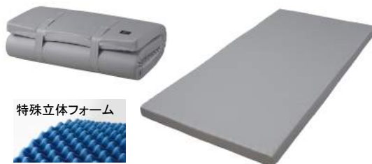
特殊立体フォーム

サイズはシングルからダブルまで展開 カラー:グレー 側地:(表)表地:ポリエステル85%、綿15%・中わた/内地:ポリエステル100% 裏)ポリエステル85%、綿15% メッシュ部分:ポリエステル100% 詰め物:ウレタンフォーム