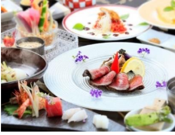
五感で味わう料理