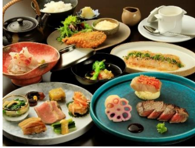
熱海ならではの山海の幸を堪能