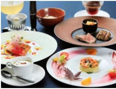
ナチュラルIZU フレンチ