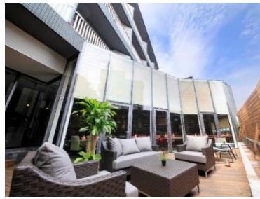
レストランテラス