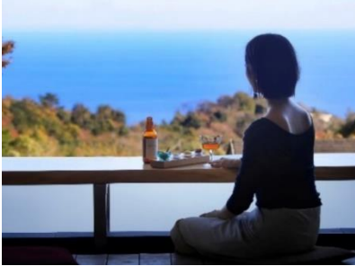
海を望む足湯カフェ

相模湾を一望する足湯カフェや、鉄板ダイニングにて出来立てのお料理をお楽しみいただける1泊4食付き温泉旅館。旅の疲れを癒すウェルカムアフタヌーンティーから始まり、地産食材に拘った夕食に滞在の夜を彩るメパフェ、そして名物フレンチトーストを味わう朝食と計4食をお楽しみいただけます。