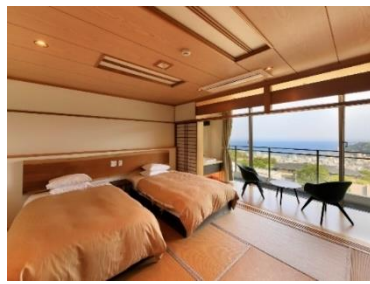
遠く相模湾を見下ろす客室